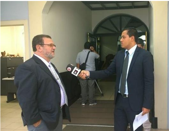
La presentación de la propuesta de Petrocaribe despertó gran interés en la prensa y otros sectores.